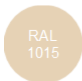
Светлая слоновая кость