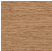
3099 Бесцветное матовое